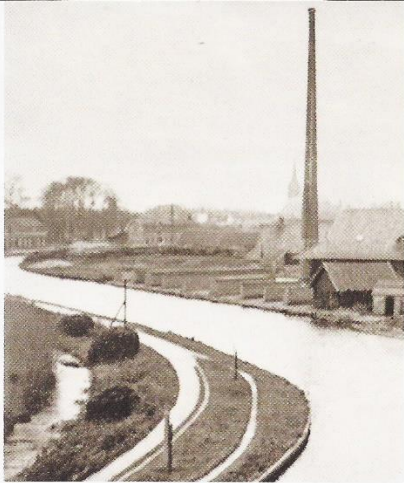
Twee rolpalen met het jaagpad langs de Hollandse IJssel rond 1920. Rechts de verdwenen steenfabriek.