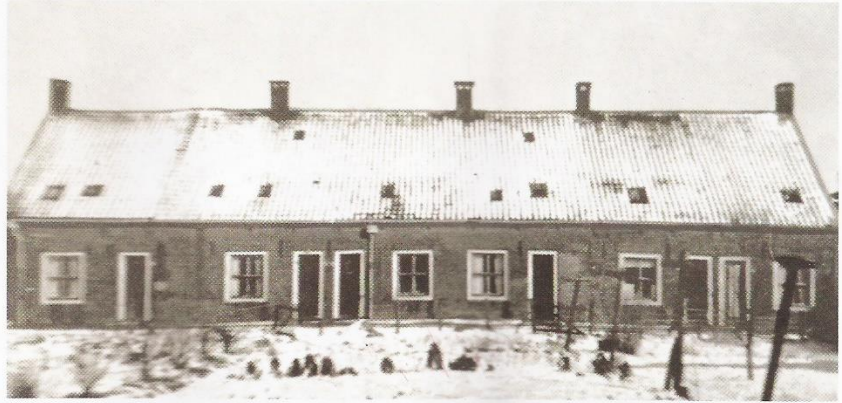
De 6 arbeidershuisjes aan het Oranjelaantje in het winterlandschap van 1935. De huisjes zijn in 1962 gesloopt bij de bouw van de Oranjebrug.