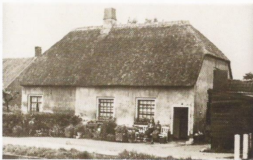
Het schipperscafé (rechts) langs het jaagpad rond 1935. Links op de achtergrond de kap van het laatste huisje (zie boven) aan het Oranjelaantje.