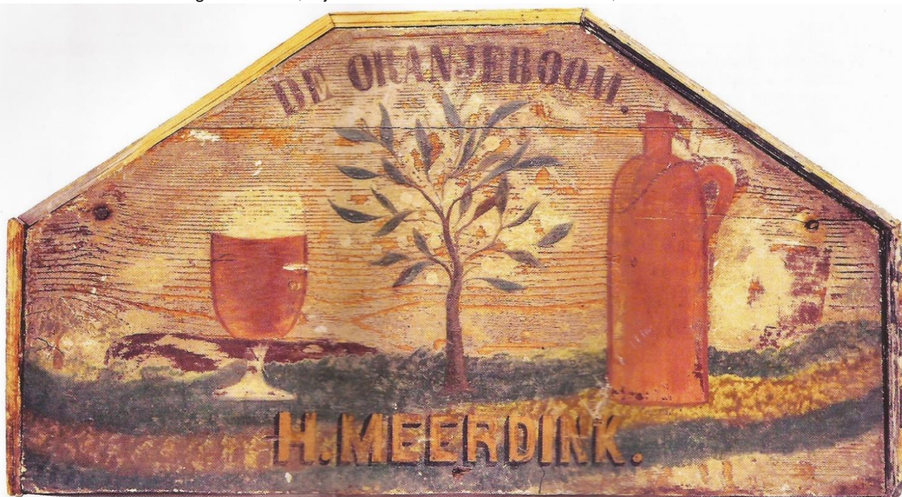
Het houten paneel met opschrift en tekening 'De Oranjeboom' dat zich in de cultuurhistorische collectie van museum MIJ bevindt. Het is 36,5 x 68 x 4 cm groot.